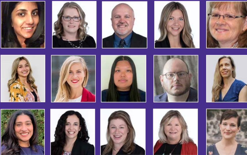
Membres de l'équipe nationale